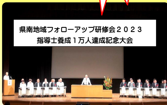
県南地域フォローアップ研修会2023 指導士養成1万人達成記念大会

つくばシルバーリハビリ体操指導士会はつくば市、茨城県と一体となり、高齢者の健康増進、介護予防対策に取り組み、20周年を迎えました。本年は20周年を記念し「健康長寿日本一をつくばから」を目標に「シルバーリハビリ出前体操教室」を1団体5名以上の参加で毎月2回(年間24回)まで無料で皆様の近くの集会所や自治会館等に出前出張して参ります。