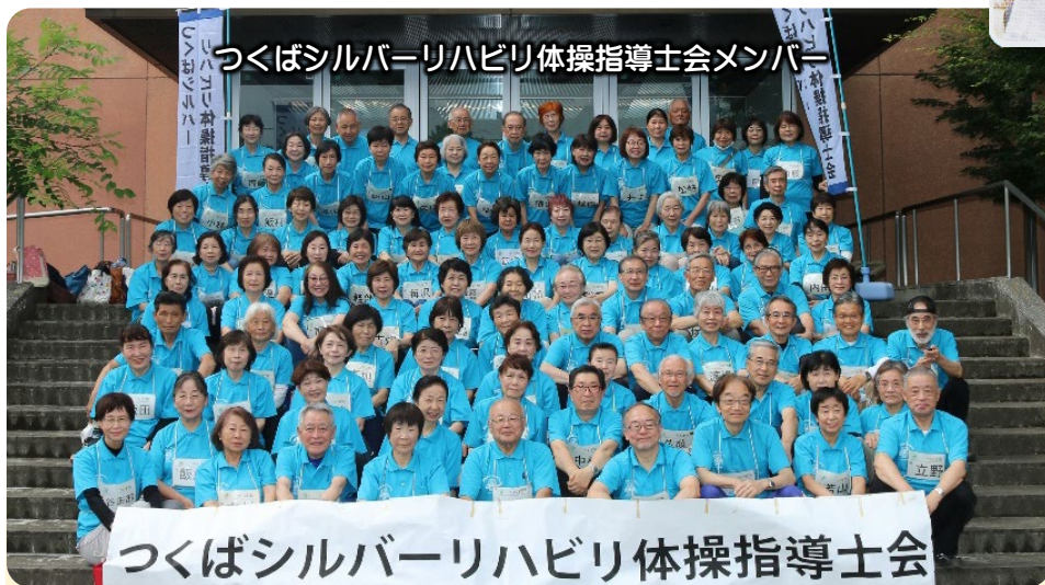
つくばシルバーリハビリ体操指導士会メンバー