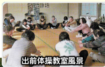
出前体操教室風景